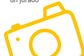
El sistema LMD y los diplomas de arte

> Un procedimiento de admisión sin concurso y sin pasar físicamente ante un jurado